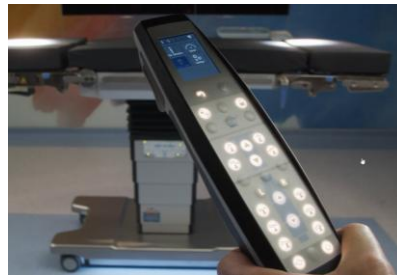
ディスプレイリモコン