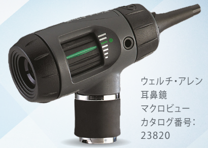
ウェルチ・アレン 耳鼻鏡 マクロビュー カタログ番号: 23820

マクロビュー（カタログ番号：23820）は、2026年12月末をもって修理サポートを終了いたします。本体に不具合がない場合は引き続きご使用いただけますが、今後、破損や接触不良が生じた際には修理対応を承ることができかねます。