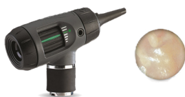
マクロビュー（品番：23820）