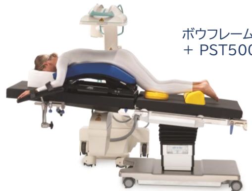
ボウフレーム + PST500

販売名 : アレン スパイナルシステム 一般的名称 : 手術台アクセサリ 届出番号 : 13B2X10356000066 クラス分類 : クラスⅠ 一般医療機器